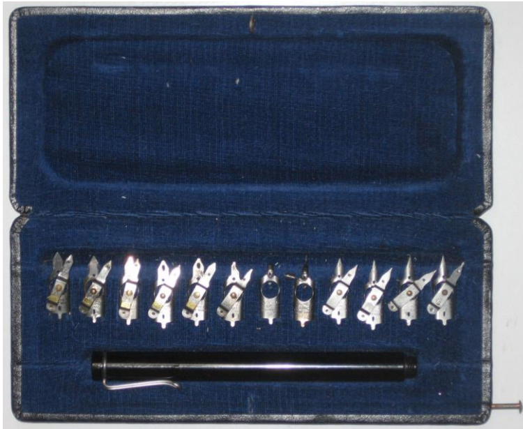
Fig. 8. Pelikan Graphos doos met inhoud.