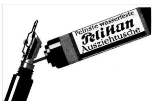
Fig. 1. Vanaf 1934

De eerste exemplaren hadden een bakelieten houder, latere exemplaren waren van plastic. Deze houder, zie figuur 1, kan gevuld worden met een speciale inktpatroon door een opening aan de achterkant. Na 1978, toen Pelikan behoorde tot het Rotringconcern, werd eenzelfde soort interne inktcontainer gebruikt als bij de Rotringpennen en werd de houder deelbaar. Op de houder kwam toen ook de naam Rotring te staan. Zie figuur 2. Dat heeft maar enkele jaren geduurd, tot 1982.