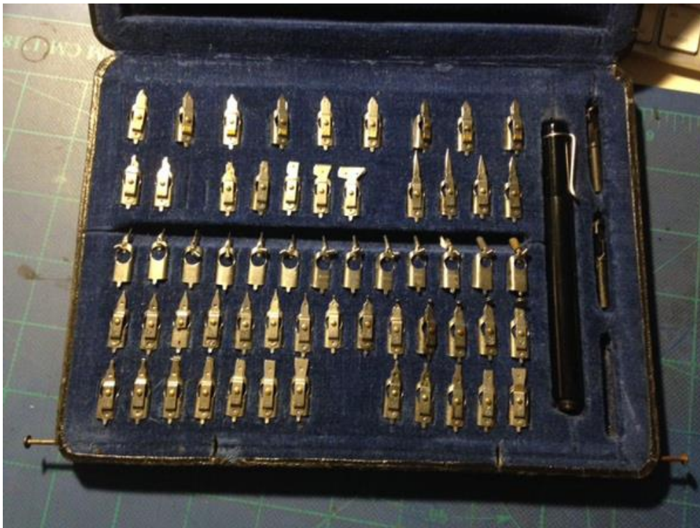
Fig. 9. Grote doos met houder en nagenoeg alle typen pennen.