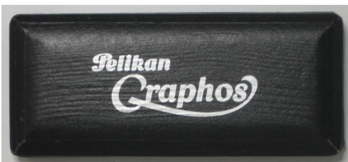
Fig. 7. Pelikan Graphos doos met houder en pennen.