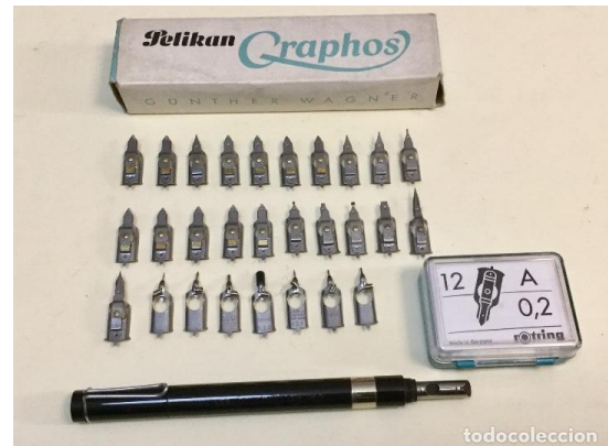
Fig. 5. Collectie pennen.