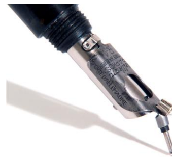
Fig. 6. Veertje in buisjespen R