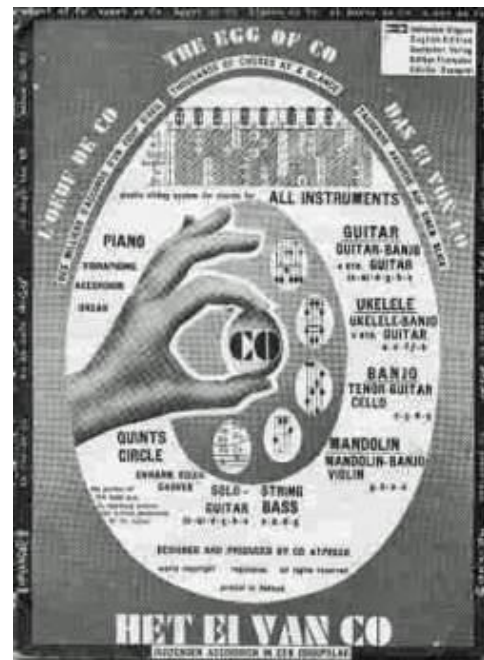
Fig. 2. Handleiding.

Het valt buiten de geringe muzikale kennis van de auteur om het gebruik volledig uit te leggen, maar het is misschien voldoende om aan te geven dat de schuifkaart geleverd werd met een 27 bladzijden tellende gebruiksaanwijzing. Naast de Nederlandse handleiding werden ook Engelse, Duitse, Franse en Spaanse versies uitgebracht.