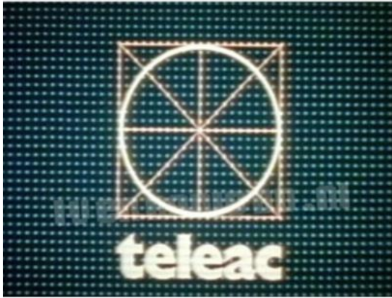
Fig. 3. Het beeldmerk van Teleac.

In de volgende decennia nam de vraag naar de akkoordenschuifkaart niet af. In 1984 bijvoorbeeld, zond de Nederlandse Omroep, in samenwerking met TELEAC (Televisie Academie), een Lets Swing -cursus uit om jazz te leren spelen. Het Ei van Co was een onderdeel van het aanbevolen cursusmateriaal.