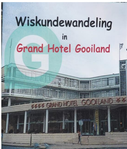
Jubileumboekje NVvW, 18 april 2015

Dat is natuurlijk ook het organiserende comité van het jubileumcongres van de NVvW niet ontgaan. Ter ere van het 90-jarige bestaan ontving iedere deelnemer aan het congres een boekje met een wiskundewandeling door het Grand Hotel Gooiland, een wandeling langs een aantal bijzondere mathematische verschijnselen in het gebouw.